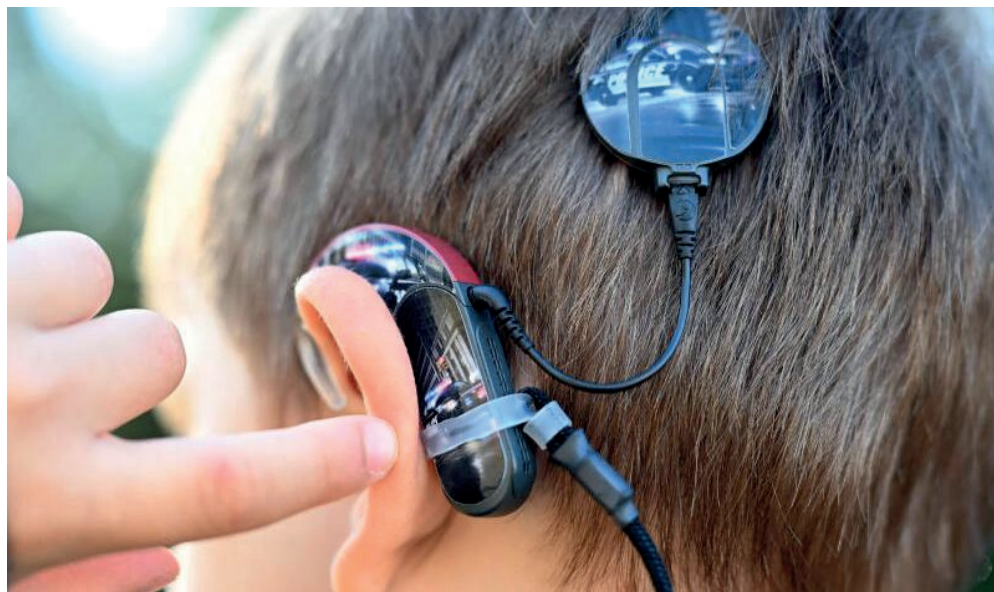
Am Hinterkopf eines siebenjährigen Jungen ist ein Cochlea-Implantat, eine Hörprothese, angebracht, das hochgradig Schwerhörigen und Ertaubten das Hören ermöglicht. Bei der Technik werden die Nervenzellen des Hörnervs elektrisch stimuliert. Dafür wird ein Elektrodenträger in die Hörschnecke eingeführt. Der äußere Teil besteht aus einem Mikrofon und einen Prozessor, der die Schallinformationen in elektrische Impulse umwandelt.

Für viele Mitglieder der Gruppe sei es anstrengend, Alltagssituationen zu meistern. „Selbst für Höreräteträger ist Kommunikation Hochleistungssport. In öffentlichen Räumen, bei Gesprächen oder Lesungen, ist es oft ein Kampf, alles richtig zu verstehen“, so Bolte. Die Gruppe „Open Ohr“ trifft sich einmal im Monat. „Der Kern besteht aus et-