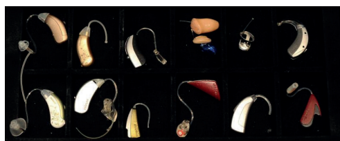
13,3 Millionen Bundesbürger über 14 Jahre gelten als beim Hören beeinträchtigt.

wa acht festen Teilnehmern, insgesamt stehen 27 Personen in unserem Verteiler“, sagt Bolte. Sie erzählt, dass die Treffen als Austauschplattform dienen. Besprochen werden Alltagssituationen und Erlebnisse, wie zum Bei-